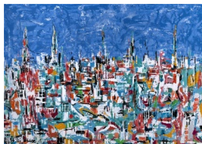
"Cercare" Tecnica mista su tela 70X100