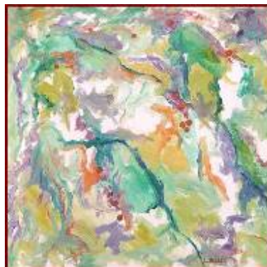
"L'Albero di Ciliegie" Olio su tela 70X80