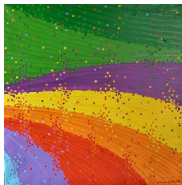
"Campi in fiore" Olio su tela 80X80