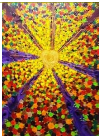
"Luce d'autunno" Olio su tela 60X80