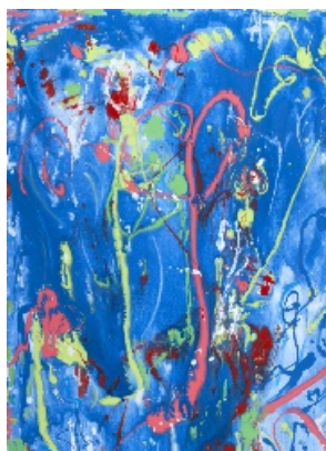
"Graffiti marini" Tecnica mista su tela 70X100