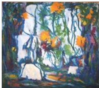
"Lo Scranno di Roma" Olio su tela 70X80