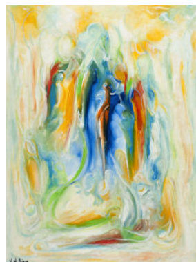
"Delicatezza" Tecnica mista su tela 60X80