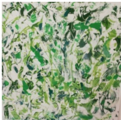
"Monocromismo gioioso" Tecnica mista su tela 100X100