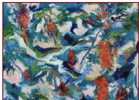
"La Cova" Olio su tela 70X80