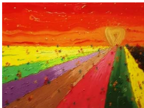
"L'alba del cuore" Olio su tela 80X60