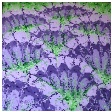
"Lavanda" Olio su tela 80X80