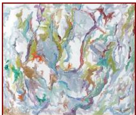
"La Grande Quercia del mio giardino" Olio su tela 70X80